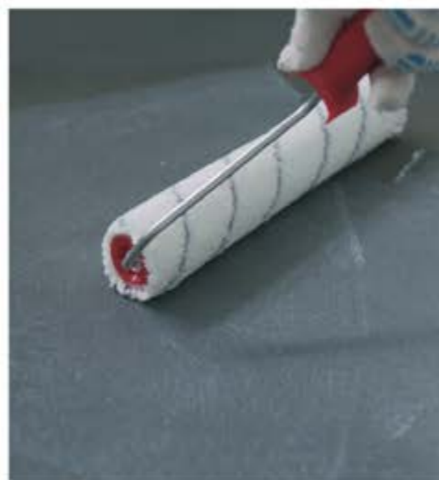
SELLADOR Y MEMBRANA DE CURADO HIDROFUGANTE

El sellador-hidrofugante acrílico transparente, libre de solventes, base agua y amigable con el medio ambiente, desarrollado para sellar superficies verticales u horizontales, así como piezas prefabricadas, penetrando en los poros proporcionando impermeabilidad, ya que su ingrediente activo repelente al agua reacciona con el sustrato. Es altamente resistente a la luz solar, intemperie y alcalinidad, lo cual permite su permanencia en el transcurso del tiempo. Se adhiere fuertemente a superficies de cemento, piedras o barro, evita la eflorescencia o salitre, protegiendo la capa superficial e incrementando la vida del sellador. Al secar produce una película transparente de alta durabilidad que no se torna amarilla ni se le adhiere el polvo.